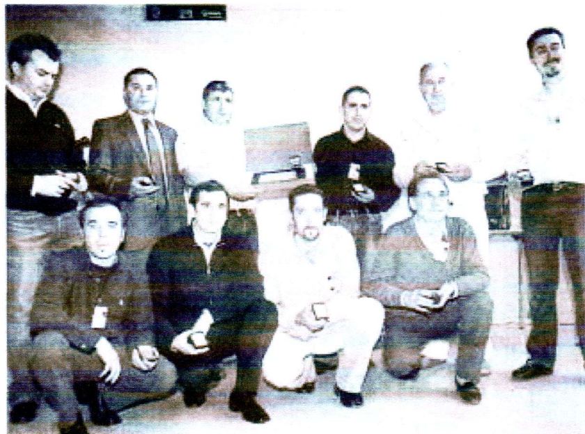
Los premiados en esta V edición de Imaginaria posaron para los fotógrafos inmediatamente después de que el alcalde, Javier Gago, inaugura el evento.

en Imaginaria y expresó en voz alta el respeto al esfuerzo que para estas personas supone presentárselas. El acto de inauguración se desarrolló al mismo tiempo que la Fundación Fexdega entregó los premios de esta edición a los mejores inventos.